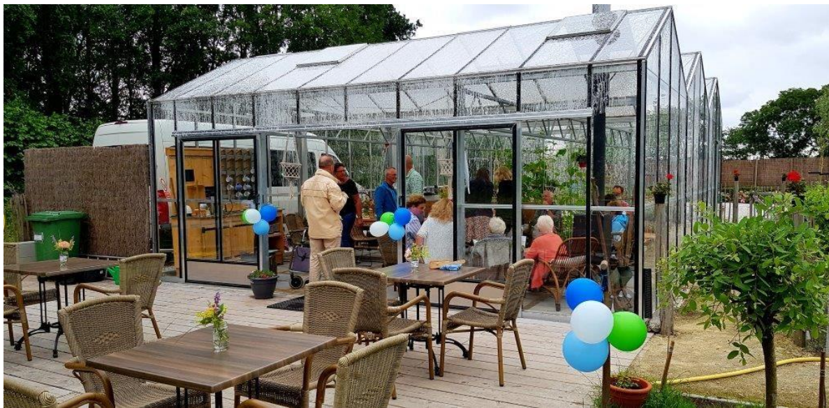
Afbeelding 1: Feestelijke opening tuinkas

Op 12 mei 2017 is Zorgboerderij BuitenGewoon 3 geopend. Deze nieuwe woonvoorziening is gerealiseerd op het terrein van een voormalige boerderij. Veertien mensen met dementie, die 24-uurs verpleeghuiszorg nodig hebben, kunnen hier wonen. Het ideaal is dat mensen die eerder gebruikmaakten van de dagverzorging BuitenGewoon , waarvan één locatie is gelegen op het zelfde terrein, hier een plaats krijgen wanneer hij/zij niet langer meer kan thuis wonen. Ook vanuit het op het terrein gelegen Respijtzorg BuitenGewoon is dit mogelijk. De nieuwe bewoner blijft dan in een bekende en vertrouwde omgeving, waardoor de overgang naar de 'nieuwe' woonsituatie minder ingrijpend is en hij zich sneller zal 'thuis' voelen. U begrijpt dat onze eerste 'zorg' was om de persoonsgerichte zorg zo in te richten dat alle nieuwe bewoners zich daadwerkelijk thuis gingen voelen. Ook in het verslagjaar 2018 waren wij volop in ontwikkeling om kwaliteitsaspecten in te richten. Des al niet te min willen wij in dit kwaliteitsverslag een aantal kwaliteitsaspecten met u delen en zullen wij volgend jaar uitgebreider verslag doen. Dit verslag wordt tevens openbaar gemaakt op onze website: http://zorgboerderijbuitengewoon.nl/